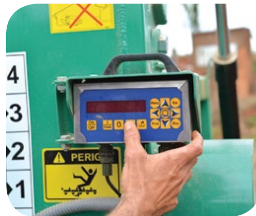
Balanza electrónica programable de serie.