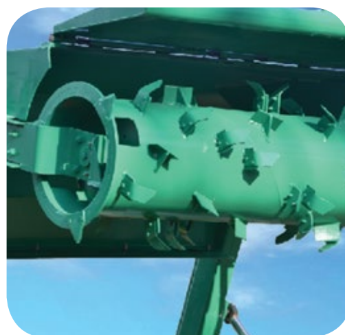
Fresas con cuchillas atornilladas de accionamiento hidráulico.