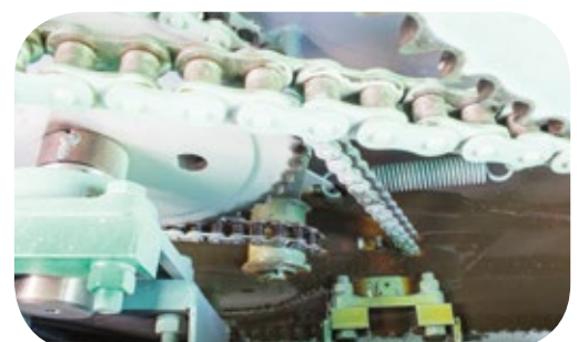
Sistema de transmisión bañado con aceite.