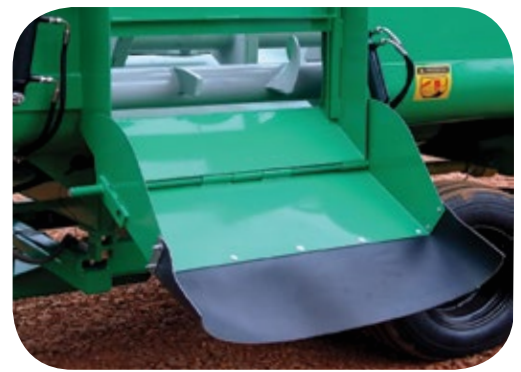
Tubo de descarga por gravedad con regulación.