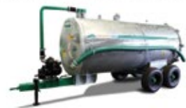
Unitank Distribuidor de fertilizante líquido