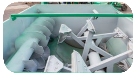
Cámara de mezcla.