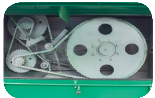
Transmisión trasera para una mejor distribución del peso del equipo.