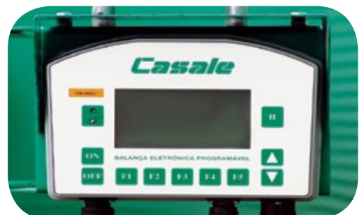
Balanza electrónica programable de última generación.