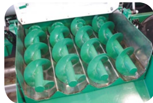
Tubo de descarga con 4 roscas rápidas.