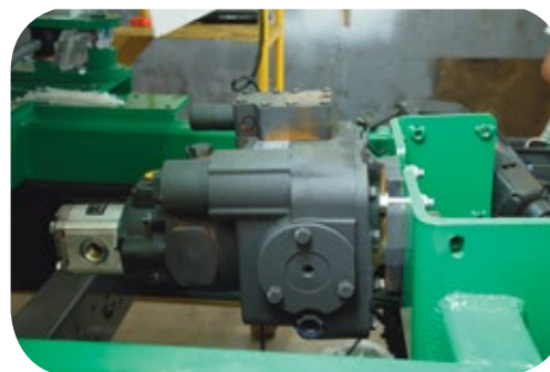
Bomba de accionamiento hidrostática.