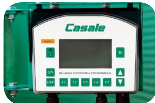
Balanza electrónica de serie.