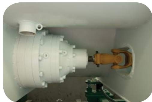
Transmisión principal por medio de un reductor planetario.