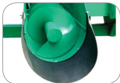
Rosca sem-fim para descarga dianteira.