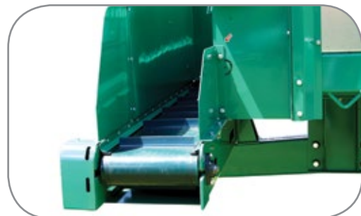
Esteira de descarga em PVC.