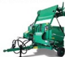
Rotormix Mini Autocarregável