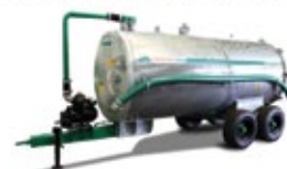
Unitank Esterco líquido