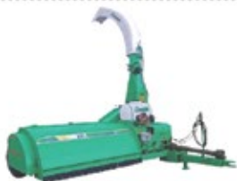
CRC - AP