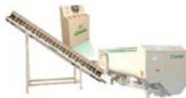
Rotormix Profi Estacionária