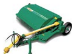
Sega Pasto Segadora, condicionadora e podadora de pasto