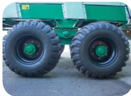
Rodado Tandem (opcional).