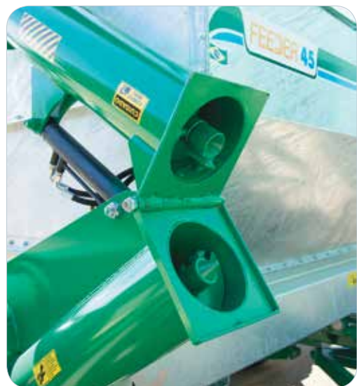
Rosca de descarga dobrável.