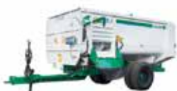
Rotormix Profi Tracionada