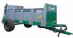
LEC Esterco sólido e compostos orgânicos