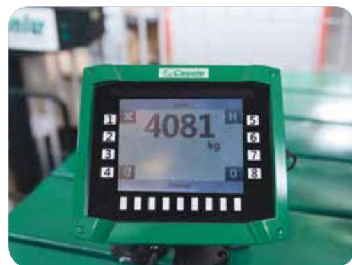
Balança eletrônica com GPS de série.