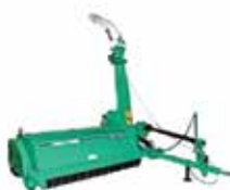
CFC - Super