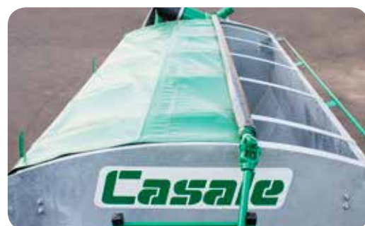
Lona para proteção.