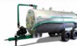
Unitank Esterco líquido