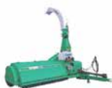
CRC - AP