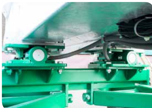
Sistema de célula de carga e suportes robustos para operação em campo.