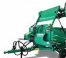
Rotormix Mini Autocarregável