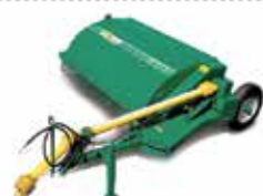
Sega Pasto Segadora, condicionadora e podadora de pasto