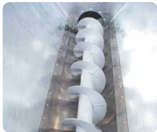
Fundo interno em aço inoxidável.