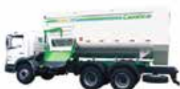
Rotormix Profi Caminhão