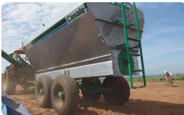
Eixo e rodado Tandem.