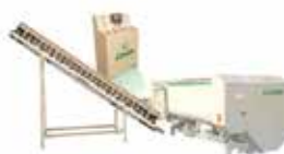
Rotormix Profi Estacionária