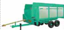
Smart Vagão forrageiro