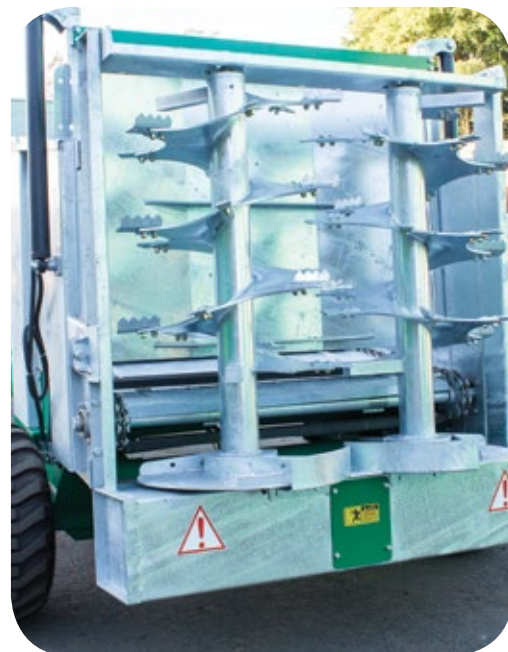
Nuevo sistema lanzador de alta capacidad con helicoides en acero galvanizado.