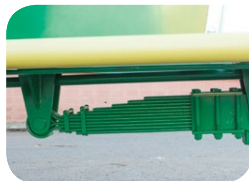
Cabezal exclusivo con sistema de suspensión por resortes de láminas.