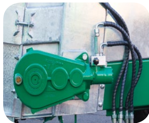
Motor reductor hidráulico: este sistema permite precisión en el control de distribución y posee mayor vida útil.