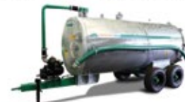
Unitank Distribuidor de fertilizante líquido