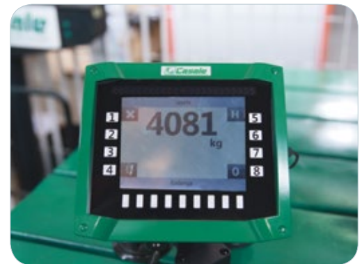
Balanza electrónica con GPS de serie.