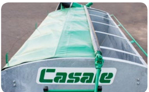
Lona para protección.