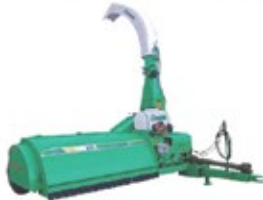
CRC - AP