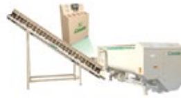
Rotormix Profi Estacionario