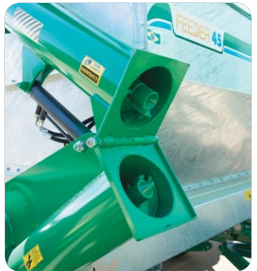
Sinfín de descarga plegable.