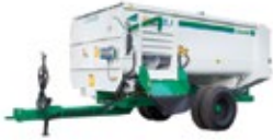
Rotormix Profi Traccionada