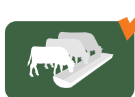
Alimentación de ganado confinado