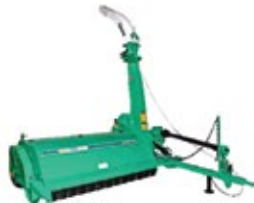
CFC - Super