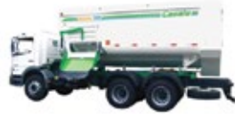
Rotormix Profi Camión