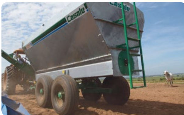
Eje y rodaje tandem.