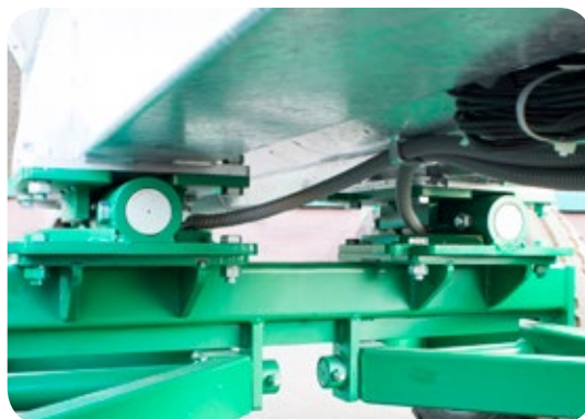
Sistema de célula de carga y soportes fuertes para el trabajo (o la operación) en campo.